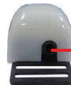
タリー入力コネクタ